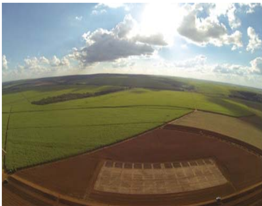
Figura 1. Vista área experimental na fase de implantação.