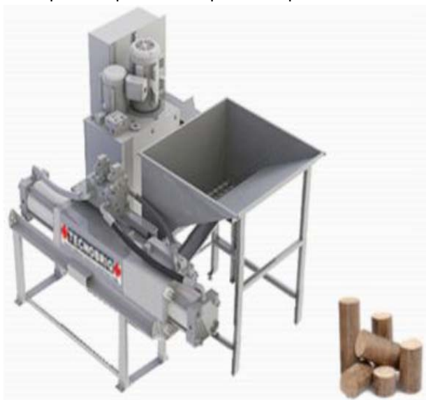
Figura 4. Prensa extrusora hidráulica. (apud ZORZAN et al., 2011)

3. Prensa hidráulica - Equipamento que usa um pistão acionado hidráulicamente. O material a ser compactado é alimentado lateralmente por uma rosca sem fim. Uma peça frontal ao embolo abre e expulsa o briquete quando se atinge a pressão desejada. Não é um processo extrusivo e a pressão aplicada geralmente é menor que em outros métodos, produzindo briquetes de menor densidade. Este tipo de equipamento seria semelhante às máquinas de produzir comprimidos e pastilhas.