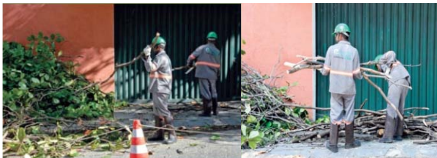
Figura 1. Realização de poda em árvores (CEMIG, 2011).

A cidade de São Paulo, por exemplo, conta com mais de 100 parques municipais, 8 parques urbanos estaduais, aproximadamente 5 mil praças, 2 áreas de proteção ambiental municipais, 3 estaduais e 2 reservas particulares, 6 parques naturais municipais e 6 parques estaduais, além de cerca de 17.800km de vias públicas. Diante dessa imensidão de vida vegetal com alta estimativa de resíduos gerados faz-se necessário o planejamento de um direcionamento adequado e, se possível, com aproveitamento e geração de renda. As cidades com mais de um milhão de habitantes, produzem em média 1,5 kg/dia habitante de lixo urbano, dos quais, 25% são decorrentes do lixo público, do qual faz parte o “lixo verde”, proveniente de podas e cortes de árvores, limpeza de praças, bosques e da capinação de terrenos, constituído basicamente de galhos, troncos e folhas (CORTEZ, 2011 apud CHALUPPE, 2013).